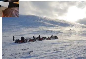
Unterwegs auf der Insel