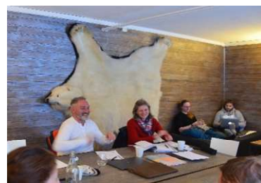
In Isfjord Radio