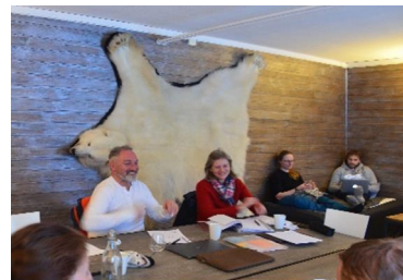
In Isfjord Radio