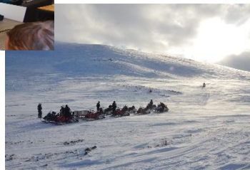
Unterwegs auf der Insel